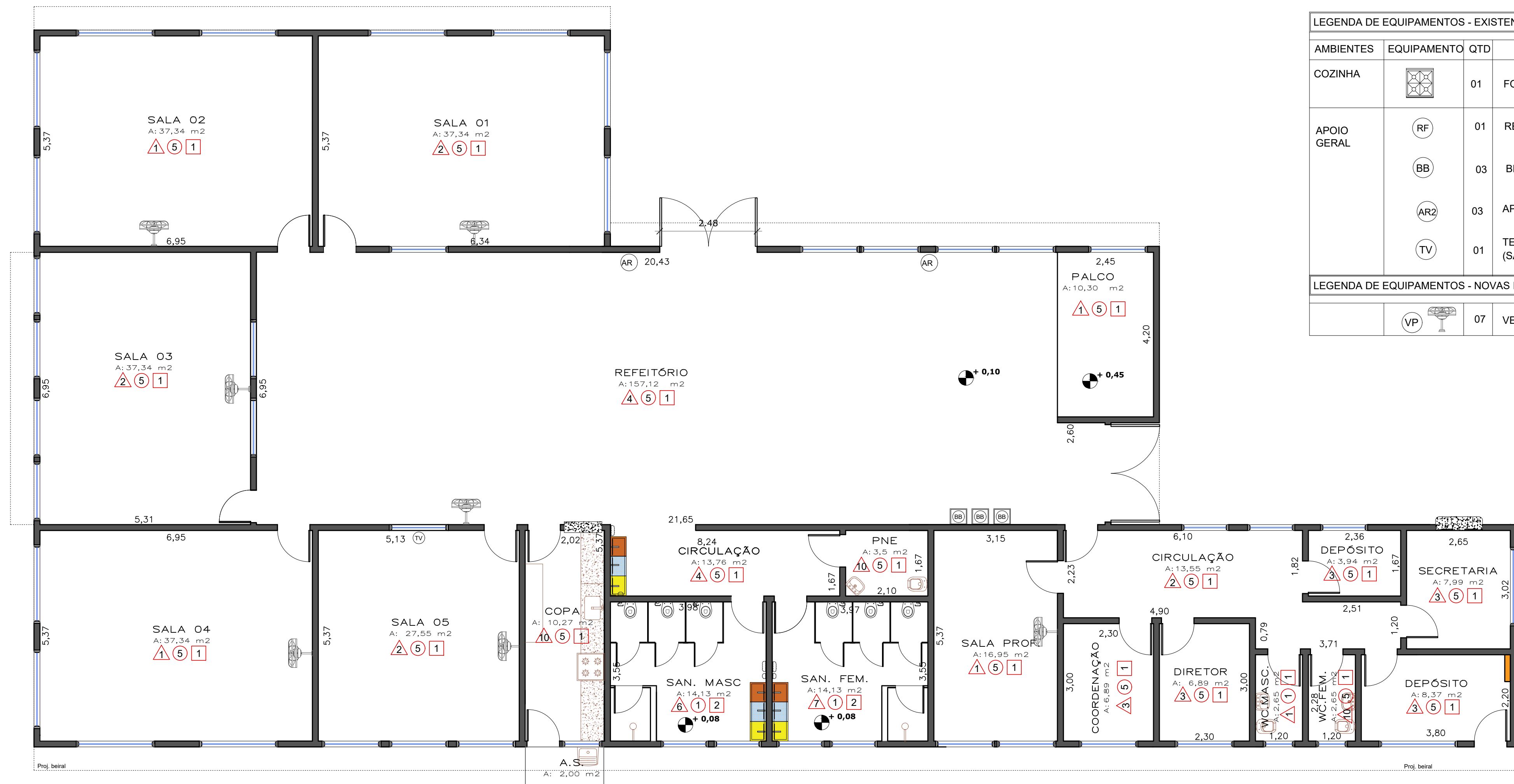
1 PLANTA DE CONSTRUIR ESCALA 1/100