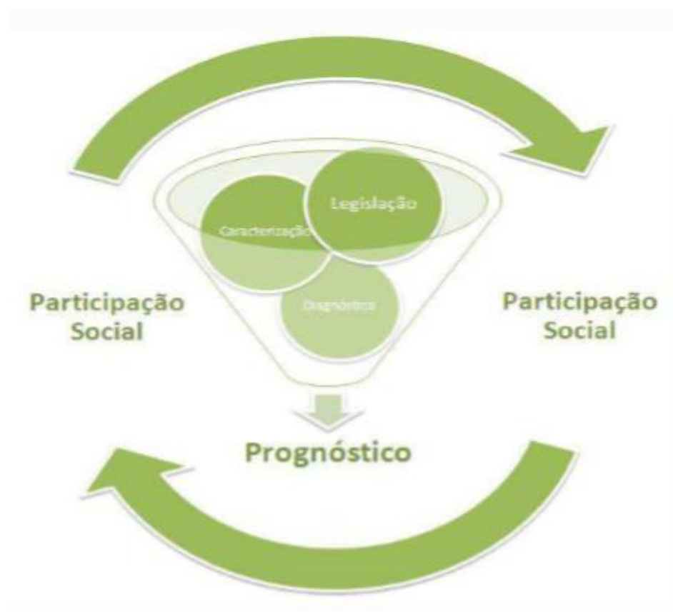
Figura 2. Interligação das etapas de construção do Plano Municipal de Gestão Integrada de Resíduos Sólidos.

Ressaltamos aqui a importância da participação social na construção do plano e a interligação das etapas.